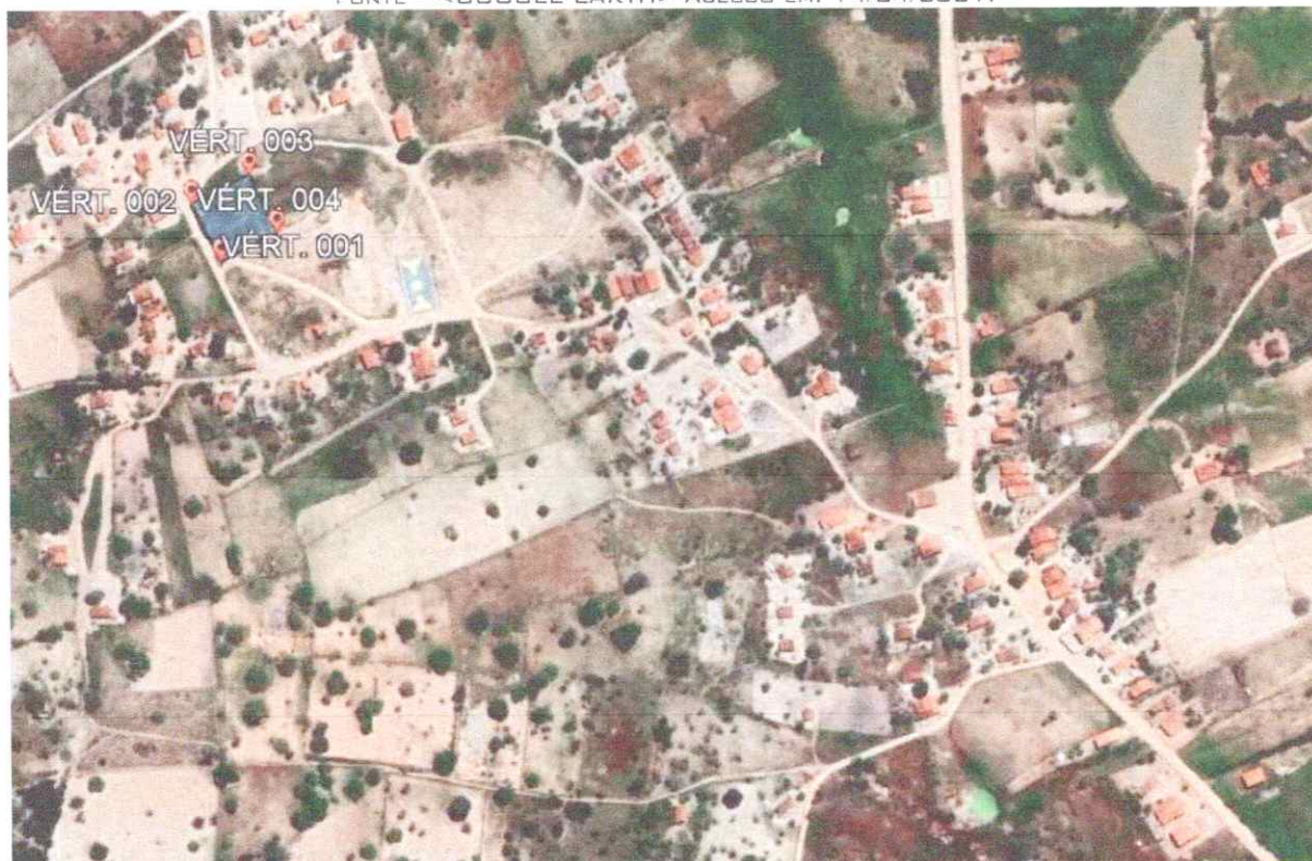
IMAGEM 02 - VISTA AÉREA DA LOCALIZAÇÃO DO TERRENO NO POVOADO FIGUEIREDO, MUNICÍPIO DE PARICONHA/AL. FONTE - <GOOGLE EARTH> ACESSO EM: 14/04/2021.

Rua Minervina Pereira, S/N – Centro, Pariconha/Alagoas