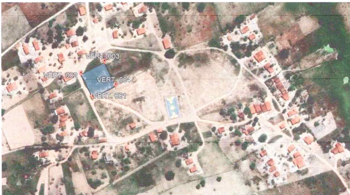
IMAGEM 01 - VISTA AÉREA DO TERRENO PARA DOAÇÃO NO POVOADO FIGUEIREDO MUNICÍPIO DE PARICONHA/AL.